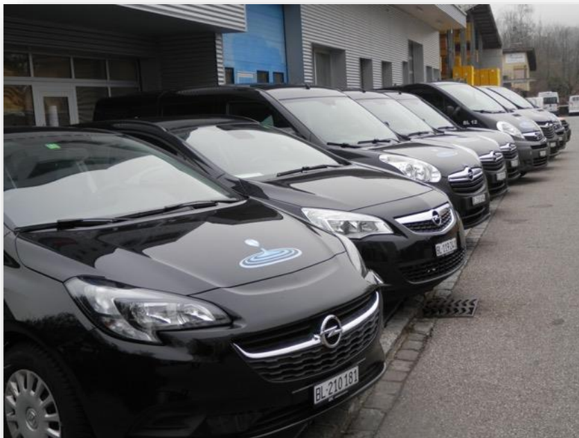
Illustration: Flotte de véhicules Meyer Reinigung GmbH