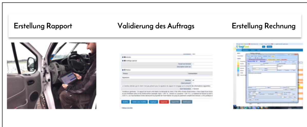
Abbildung: Übersicht über das neue Web-Planning der Lieferungen