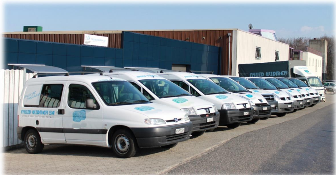
Abbildung : Fahrzeugflotte von Froid Widmer AG